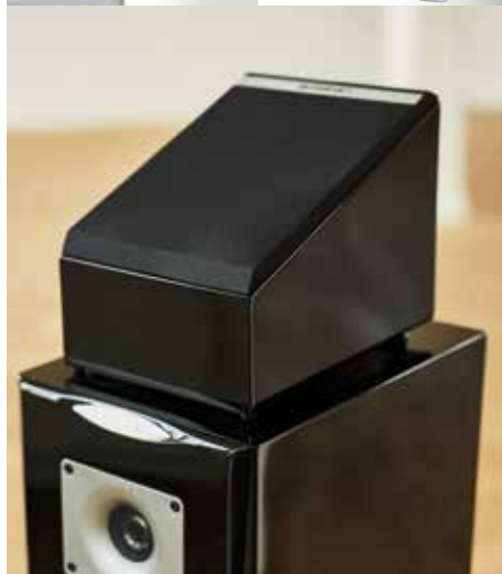
PHASE A10 auf einem Standlautsprecher

In vielen Wohnzimmern oder auch Heimkinos kann ein 5.1 Set nicht optimal platziert werden. Um trotzdem ein gutes Raumgefühl zu bekommen, arbeitet man idealerweise mit einer Diffusschallquelle, wie dem quadral PHASE 16. Mittels eines Kippschalter auf der Rückseite lässt sich der Lautsprecher als Dipol, Bipol oder als ganz normaler Lautsprecher verwenden.