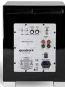
Rückseite QUBE 8