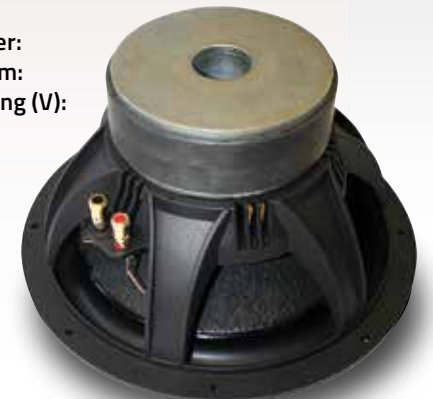
Chassis QUBE 12 mit mächtigem Magneten