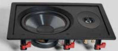
Klassische 2-Wege-Anordnung CASA W80