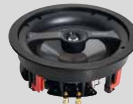
2-Wege Coax-Anordnung CASA C8

Bei den Lautsprechern der PHASE und CASA-Serie handelt es sich durchweg um 2-Wege-Konstruktionen (Ausnahme A10). Dadurch entsteht ein sehr differenziertes Klangbild mit klaren Höhen und einem – für diese Größe – sehr voluminösem Fundament. Zur individuellen Anpassung an die Räumlichkeiten sind die CASA-Einbaulautsprecher mit einem regelbaren Hochtoner (+/- 2 dB) ausgestattet.