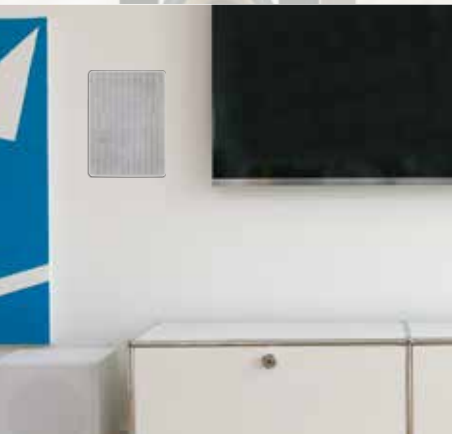
Fast unsichtbar dezente Surround-Lösung mit CASA & QUBE