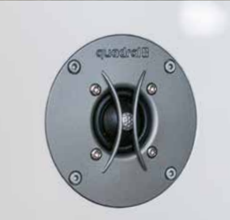
Super Audio Tweeter mit verbesserter Abstrahlcharakteristik