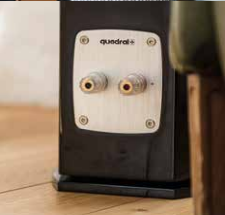
Metall-Terminal mit vergoldeten Anschlüssen

PLATINUM AWARD CHROMIUM STYLE 6 Hi-Fi-Insights (UK) 04/2018