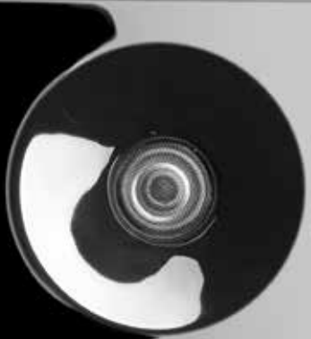
RiCom+ Hochtöner mit aufwändigem Wave Guide