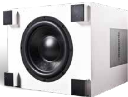
Tieftöner QUBE 12

Vervollkommen Sie den Klang. Tiefe eines Kontrabasses, dunkle Schläge einer Kesselpauke, das dumpfe Grollen des Gewitters und sein knallender Donner - häufig macht erst ein Subwoofer sie zum wirklichen Erlebnis. Um die tiefen Frequenzen kraftvoll wiedergeben zu können, werden Membranen, Gehäuse und Elektronik und ihr Zusammenspiel gezielt entwickelt. Subwoofer entlasten Ihre anderen Lautsprecher, so dass diese sich ganz auf die hohen bis mitteltiefen Töne konzentrieren können.