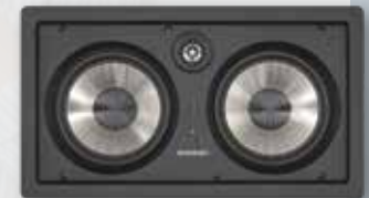
CASA CC60s auch mit Abdeckung