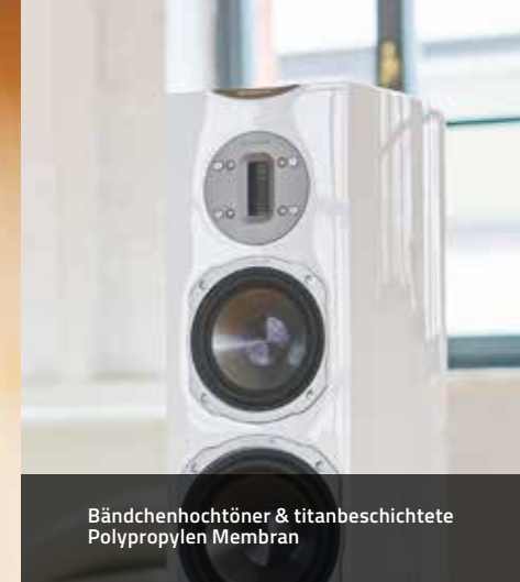
Bändchenhohtöner & titanbeschichtete Polypropylen Membran