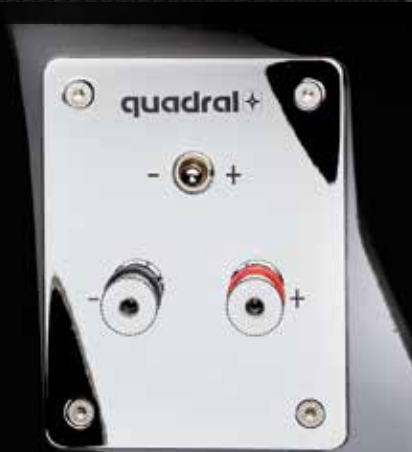
Hochwertig verchromtes Anschlussterminal mit Hochtön-Schalter