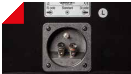
Anschluss-Terminal der PHASE 16 mit Betriebsumschalter.