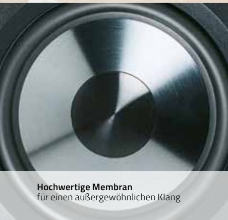
Hochwertige Membran für einen außergewöhnlichen Klang