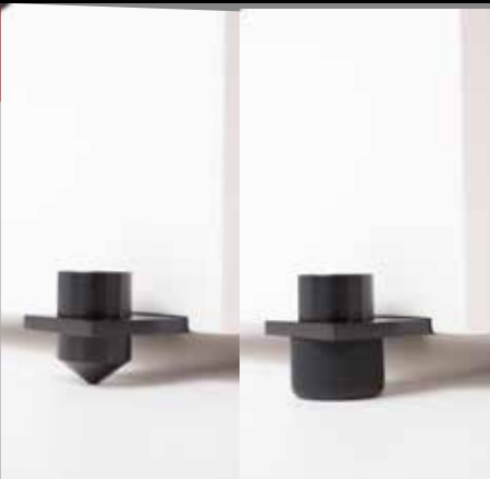
Hochwertige Spikebars für alle PLATINUM + Standlautsprecher

Serienmäßig finden sich in allen PLATINUM + Standlautsprechern stabil einstellbare Spikefüße mit abnehmbarem Silikonenschutz für kratzempfindliche Böden. Zur Ausstattung gehören außerdem verchromte High-End Terminals mit hochwertigen Schraubklemmen und Schalter für die Hochtönanpassung.