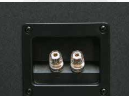
Vergoldete Anschlüsse an allen ARGENTUM Lautsprechern