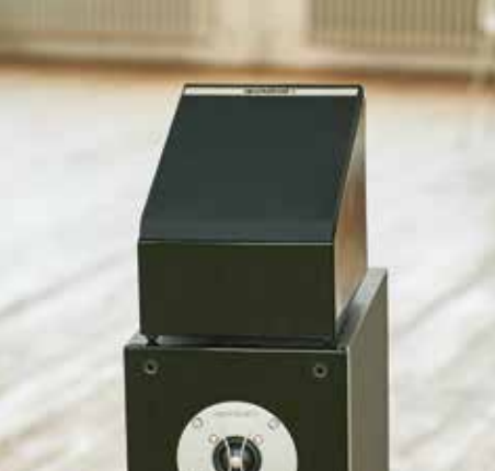
Aufsatzlautsprecher PHASE A10 für mitreißenden 3D-Sound