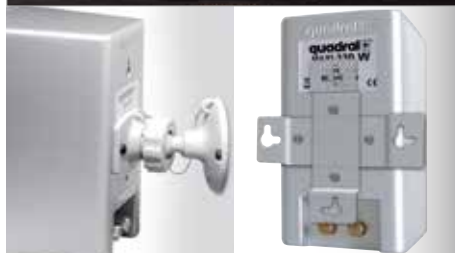
Optionale und inklusive Wandhalterung der MAXI 330W