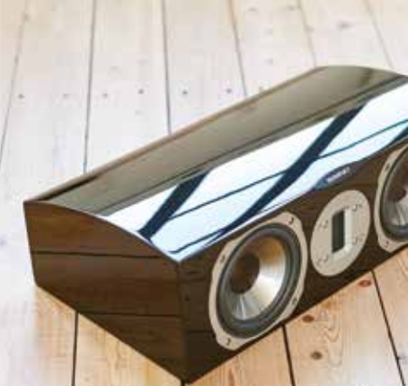
Geschwungene Gehäuselinien mit edler Hochglanzlackierung